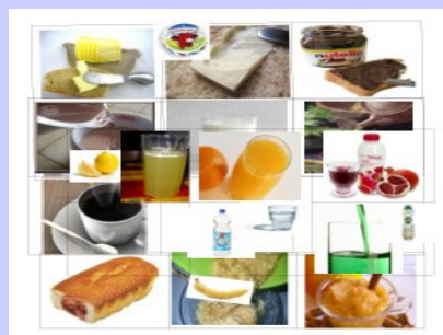
Fig. 2 : nombre de choix effectué lors des goûters parmi 24 propositions

Réalisation de 24 photographies de chaque élément du goûter habituellement proposé au sein de l'établissement (Fig2).